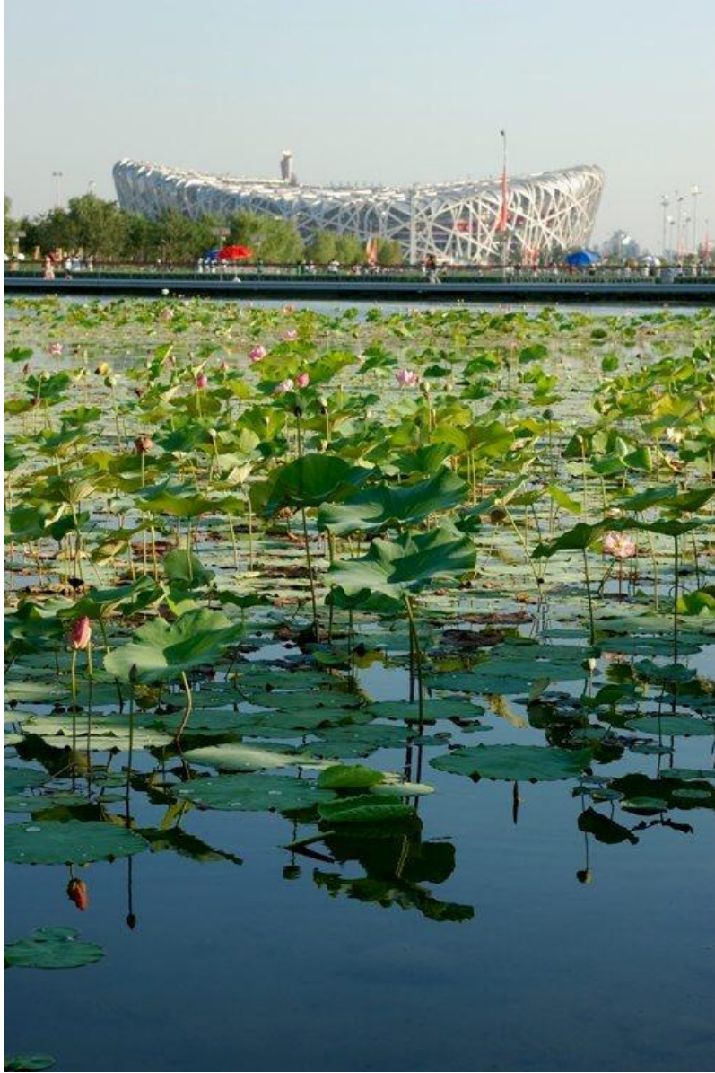
荷花池上的鸟巢：透视的原因，其实鸟巢比河边的荷花池大很多倍。